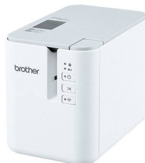
バーコード専用プリンタ

カルテなどの摩擦により文字がかすれることもなく、汚れや薬品に対しても、優れた耐久性を発揮します。